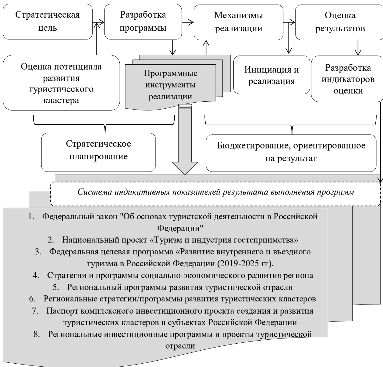
Рисунок 3 – Программно-целевой подход к процедуре формирования и развития туристического кластера в региональной экономике 1

В этой связи, представляется целесообразным использование программно-целевого подхода к становлению и развитию туристических кластеров в экономике Юга России, когда все разрабатываемые проекты должны иметь согласованную с экономической стратегией региона целевую ориентацию, а участники кластера четко представлять свои задачи в рамках следования основной цели (рис. 3).