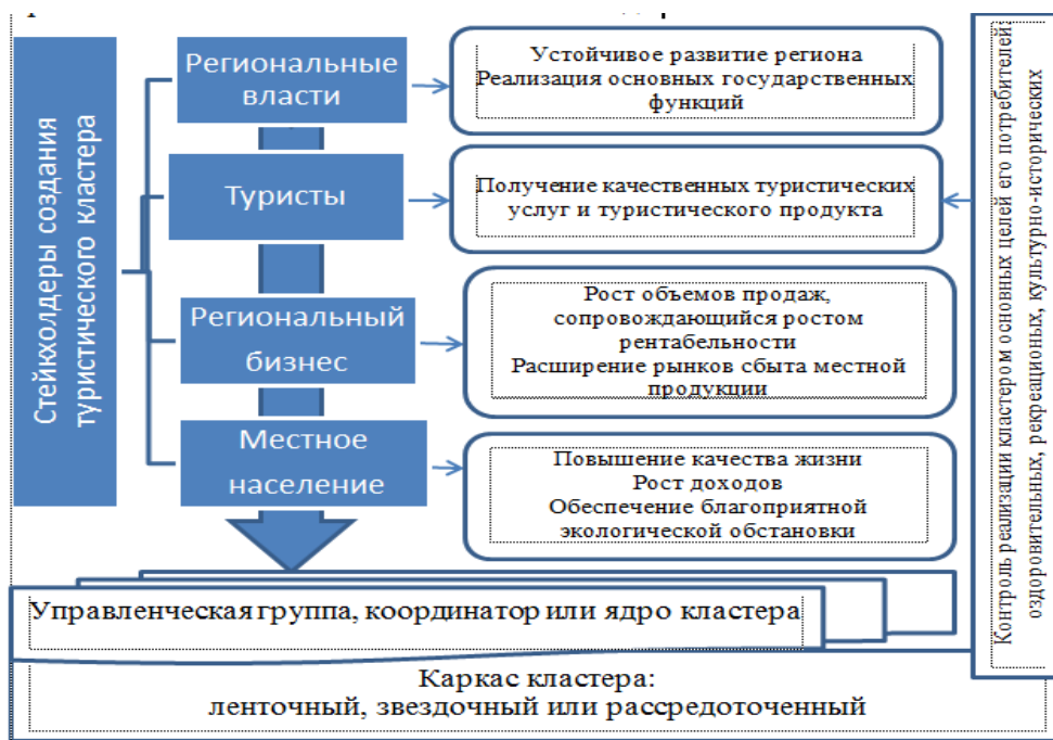
Рисунок 1 - Стейкхолдерский подход к формированию туристического кластера в структуре региональной экономики 1

реализации своих основных программ стать локомотивом экономического роста региона и выступить в качестве эффективного инструмента взаимодействия между региональными предприятиями для повышения инвестиционной активности всех его участников.